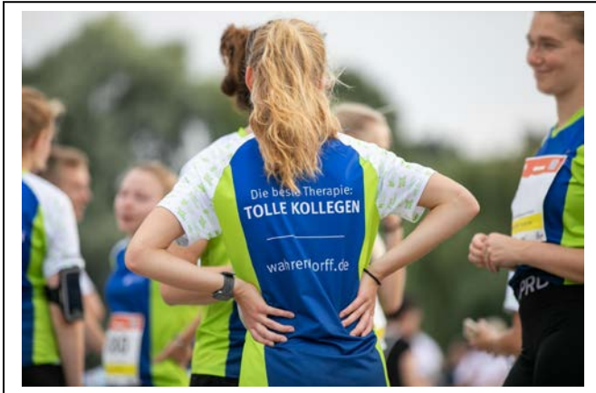
Freizeit gemeinsam mit Kolleginnen und Kollegen gestalten

Weitere Informationen unter: www.wahrendorff.de und www.brigitte.de | www.eltern.de